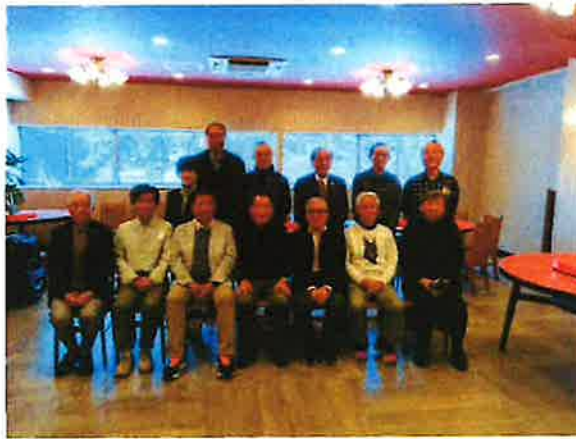
ランチとお花見会開催