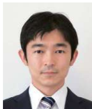
京都大学 白眉センター 特定准教授