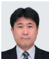
公益財団法人佐々木研究所 附属佐々木研究所 腫瘍ゲノム研究部 部長