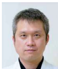
京都大学医学部附属病院 腫瘍内科 講師