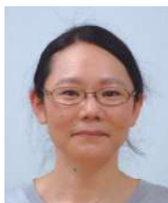
日本赤十字社 福井赤十字病院 外科 副部長