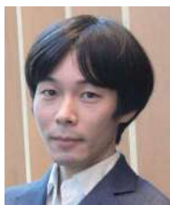
国立がん研究センター 研究所がん進展研究分野 分野長